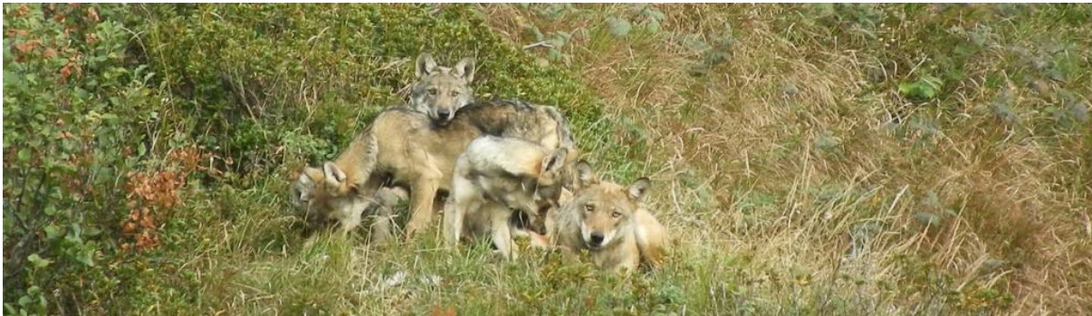
Abb.2: Grauwolf im Sommerhaarkleid.

Europäische Wölfe (Grauwolf) haben eine typische helle Gesichtsmaske, die von der Schnauze bis zur Kehle reicht. Der Wolf ähnelt in der Gestalt einem Schäferhund, ist jedoch hochbeiniger und schlanker, mit etwas kürzerem Schwanz und weniger spitzigen Ohren. Er kann 7-12 Jahre alt werden und wiegt 30 - 40kg.